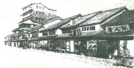
(新町・古町地区 町並みづくりのイメージ)

電子メール: kaihatsukeikan@city.kumamoto.lg.jp