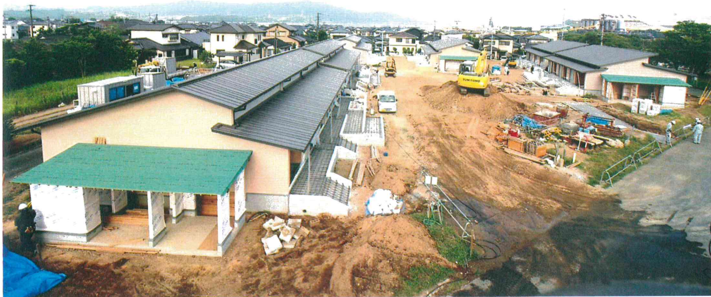
建物概要 / 木造・平屋 25戸+集会所 ※撮影/2018年7月