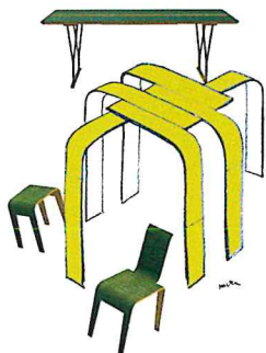
デザインスケッチ