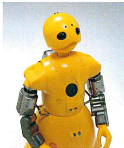
WAKAMARU 2002 Mitsubishi Heavy Industries