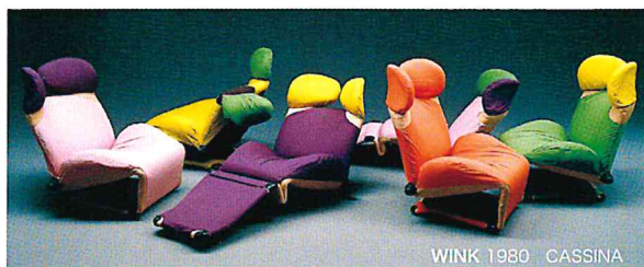
WINK 1980 CASSINA

熊本での近年の自然災害の経験は、これからの生活空間を考えるうえで、改めて『自然と人間』の関係性を見つめ直す機会となりました。