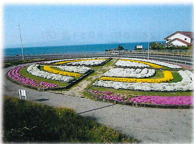
第30回 部門賞 緑と水の景観賞 「天草花咲プロジェクト」