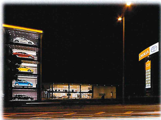
第30回 部門賞 広告景観賞 「トヨタカローラ熊本 東バイパス店」