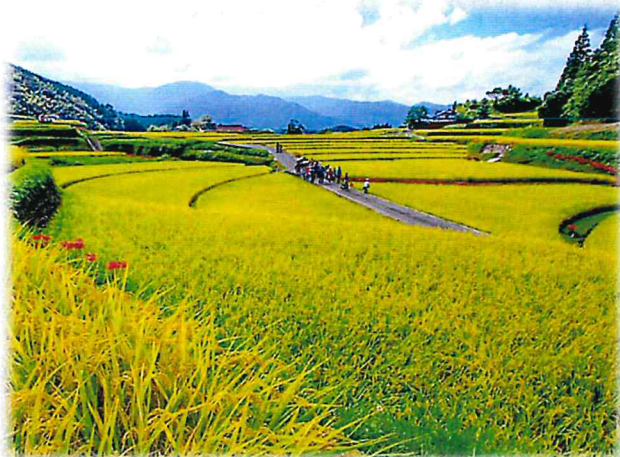
第31回 くまもと景観賞 「美里フットパスのある風景」