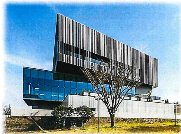
第31回 部門賞 地域景観賞 「熊本県民テレビ社屋」