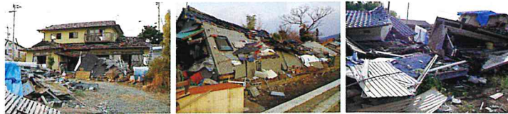
平成28年度熊本地震

熊本県では、今後の大地震に備え、皆様が安心して住み続けられる「すまい」の確保を図るため、戸建て木造住宅の耐震診断を実施しています。耐震診断士(耐震診断を行う方法を習得している建築士)がご自宅を訪問し、目視及び図面等により簡便な方法で地震に対する強さを診断(一般診断)します。