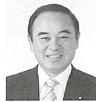
衆議院議員 坂本哲志

衆議院議員 内閣府特命担当大臣(少子化対策、地方創生) 坂本哲志 (茅葺き文化伝承議員連盟 幹事長)