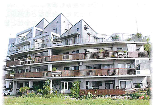
第32回 部門賞 地域景観賞 「もやい住宅Mポート」