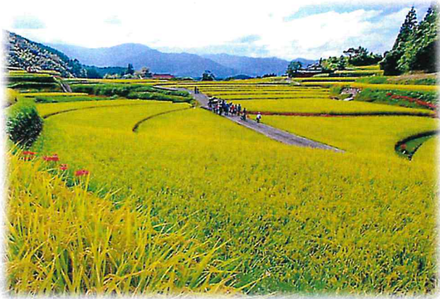
第31回 くまもと景観賞 「美里フットパスのある風景」