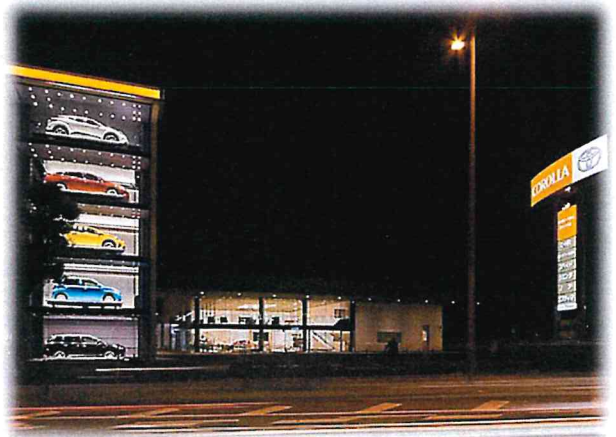
第30回 部門賞 広告景観賞 「トヨタカローラ熊本 東バイパス店」