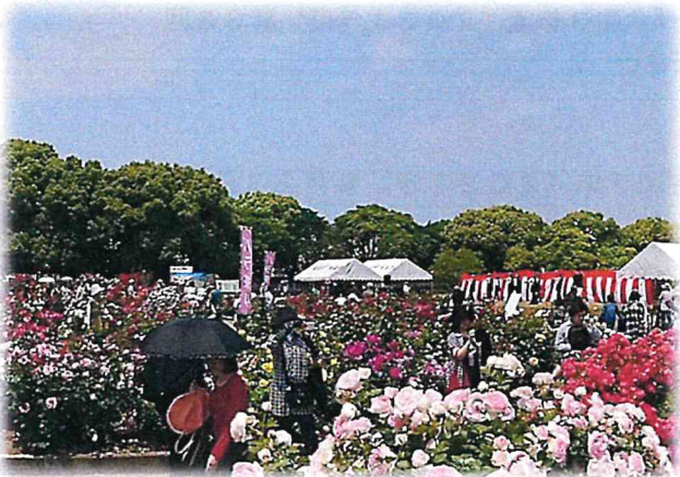
第32回 部門賞 緑と水の景観賞 「おもやい市民花壇」