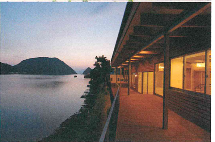
写真上3枚 三角西港の家 設計:坂本達哉(株式会社 坂本達哉建築設計事務所)